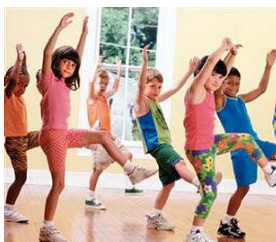
Afbeelding 2 t/m 5.

Cultuurplein Noord Veluwe adviseert scholen op het gebied van cultuureducatie. Kijk voor meer 'Cultuur Thuis' opdrachten op onze website: www.cultuurpleinnoordveluwe.nl/cultuur-thuis